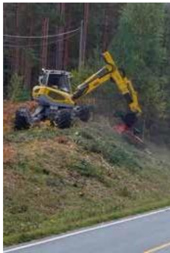
Menzi Muck käyttämässä ketjumurskainta tienvarressa