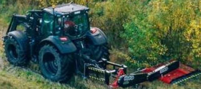
Malli M160 Standard, jossa S120 Standard sivuttaissiirtorunko