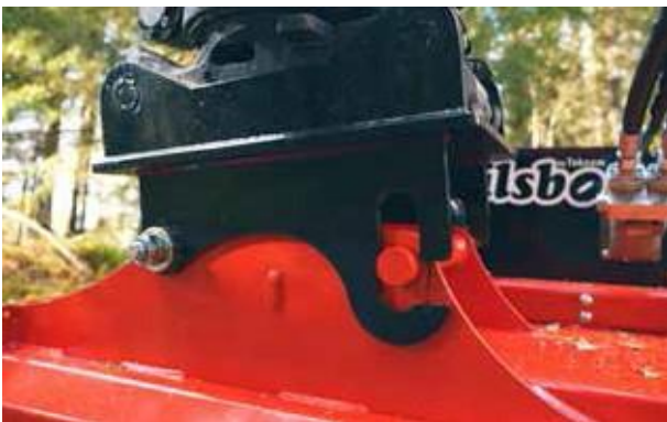
Kelluva kiinnitys mahdollistaa maanpinnan muotojen myötäilyä