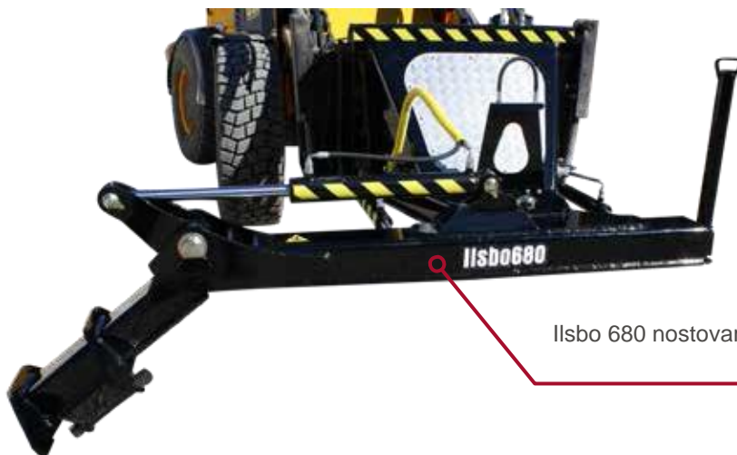
IIsbo 680 nostovarsi pyöräkuormaimeen