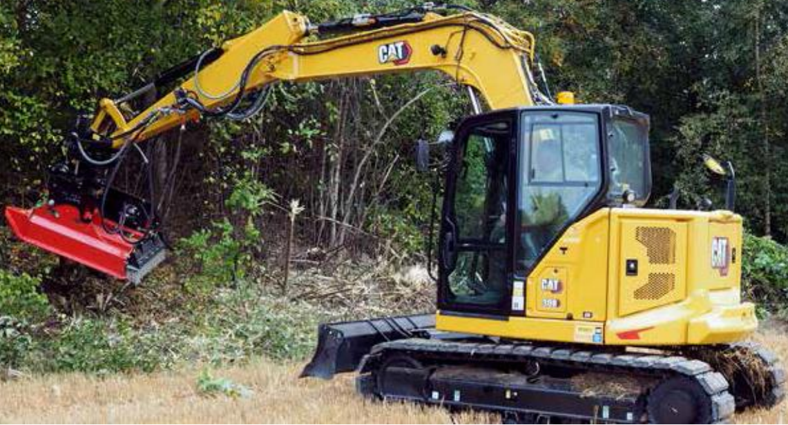
Cat 308 -kaivuri, johon asennettu IIsbo H110L