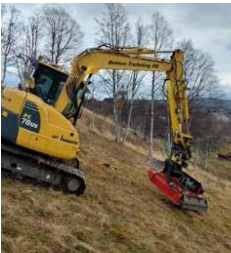
Komatsun kahdeksan tonnin kaivuri, jossa IIsbon H110L, työssä rinteessä