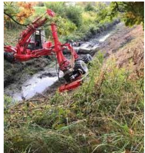
Jokivarsien raivausta erikoiskoneella ja ketjumurskaimella