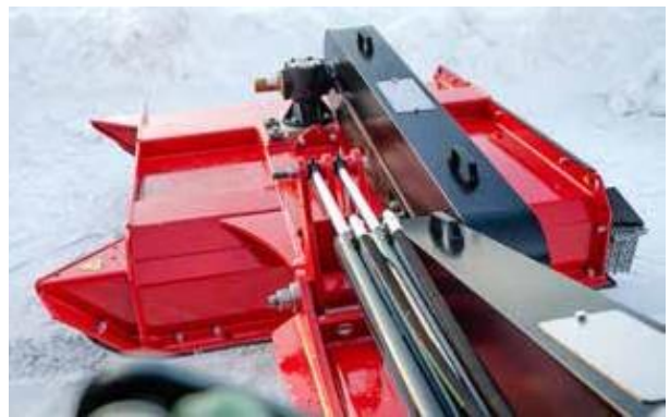
Kotelon rakenne ja erityishitsatut saumat muodostavat ratkaisun, joka kestää todella kovaa käyttöä